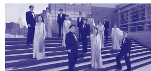
びわ湖ホール声楽アンサンブル