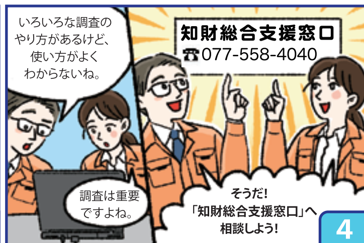
イラスト:成安造形大学 かめおかとうか