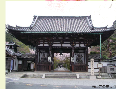
石山寺の東大門