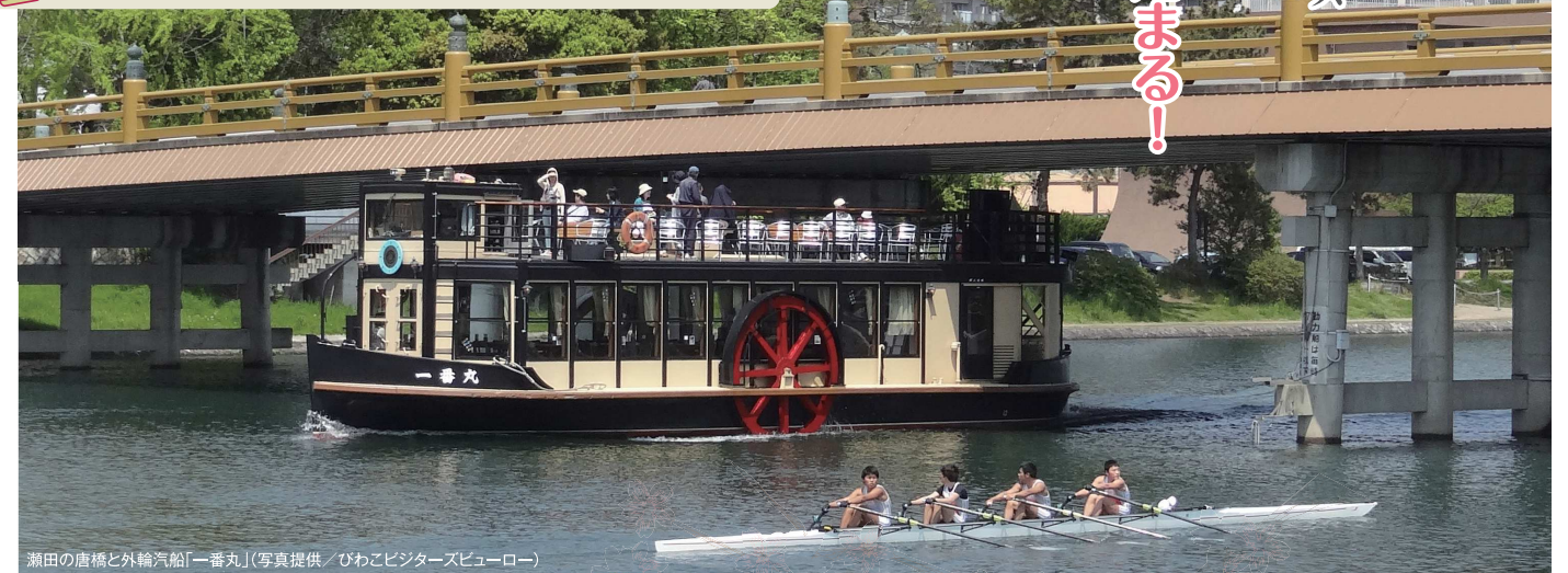
瀬田の唐橋と外輪汽船「一番丸」 ※ユリカモメの飛来は10月中旬から5月初旬まで(時期は年によって変わります)

大津市今堅田1-2-20 TEL.0120-077-572(レークウエスト観光株式会社) http://www.lakewest.jp/ 4月1日(土)より定期便運航開始(運航スケジュールは上記サイトでご確認ください) 運航ルート/石山寺港→瀬田川新港→石山寺港(※1便のみプリンスホテル港発) 料金/大人(中学生以上)1,300円、小人(小学生)700円、小学生未満無料 ※石山寺拝観券(大人1,600円、小人800円)もあります(下記の割引対象外) CARD 定期運行の乗船料金割引(大人150円引、小人100円引)