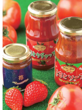
▼直売所では多彩な加工品を販売

甲賀市水口町にある「みなくちテクノファーム」では、生ごみを堆肥としてリサイクルするこだわりの農法で、新鮮な果物や野菜を栽培。味覚狩りが楽しめる観光農園として人気です。 12月から6月まで開園される「鹿深いちご園」では、摘み立てのいちごが45分食べ放題! 甘みたっぷりの品種「章姫」と、酸味と甘みのバランスがとれた「とちおとめ」がお好きなだけ味わえます。ハウス内は通路が広くバリアフリーになっているので、車いすやベビーカーでも移動がスムーズ。年中開催のトマト狩りとあわせてお楽しみください。 直売所では地元で採れた野菜や特産品を販売。夏にはかんぴょう作り、トウモロコシの収穫体験なども開催されています。