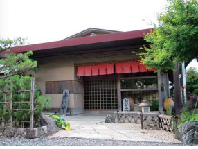
※料理写真はイメージです

●甲賀の里 錦茶屋 甲賀市甲賀町大原中1034 TEL.0748-88-3168 http://nishikityaya.com/ CARD 料理代 5%OFF(酒代は除く)