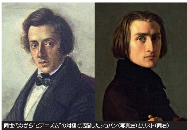
同世代ながら「ピアノイズム」の対極で活躍したショパン(写真左)とリスト(同右)

一般的に難易度が高いといわれるのは、リストの「ラ・カンパネラ」とずばり「超絶技巧練習曲」。ラフマニノフの「ピアノ・ソナタ第2番」やKEIBUN30周年感謝祭の公演で辻井伸行が挑んだ「ピアノ協奏曲第3番」も高度なテクニックが要求される。4月の久米航の公演で取りあげるラヴェルの「夜のガスパール」は、ピアニスト泣かせともいわれる難曲だ。その目と耳でぜひ確認してほしい。