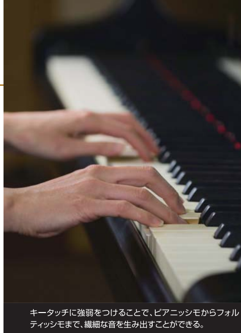
キータッチに強弱をつけることで、ピアノからフォルティッシモまで、繊細な音を生み出すことができる。

て熱狂的な女性ファンをもつアイドル的な存在だった。二十歳の時、パガニーニのヴァイオリン演奏に感動し、演奏家としてテクニックと表現力を追い求め、ピアノの魔術師とも呼ばれた。作曲家としても非凡