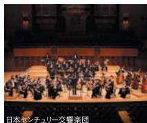
日本センチュリー交響楽団