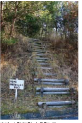
南ゲート駐車場にある登り口。

南ゲート駐車場が登り口です 急登の丸太階段をスタート! 東西に広がる希望が丘文化公園のちょうど中央に位置する南ゲートの駐車場に「南稜見晴らしコース」の登り口があります。はじめは丸太階段の急登ですが、しばらくするとやさしい尾根の緩やかなアップダウンになります。