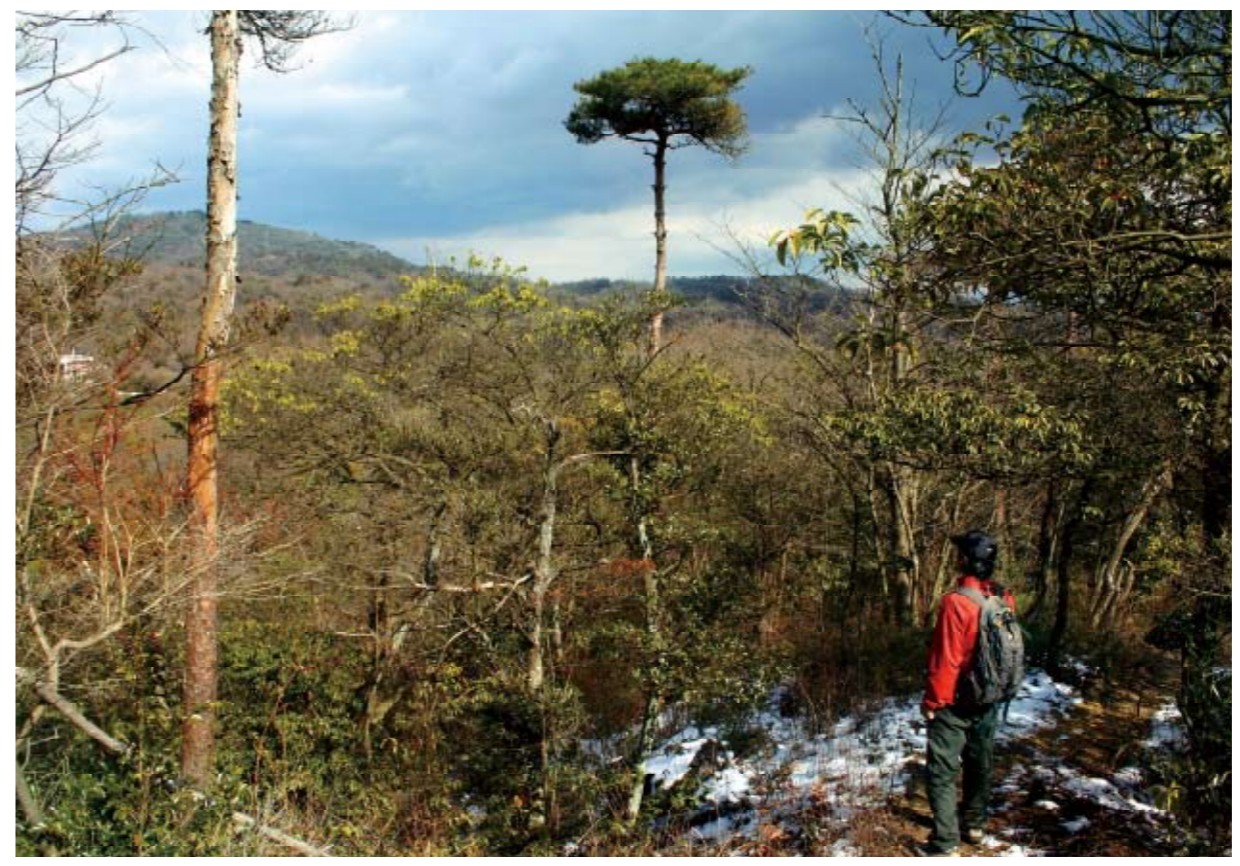
笹尾ヶ嶽から中央道へ下る稜線の途上から北稜を望む。

再びピークを踏んで青年の城へ帰りは自転車道をウォーキング 堰堤横の急な丸太階段を登りつめると眼下に希望の橋が望めます。さらに先へ進むと241mと記された最後のピーク。間近を通る名神高速道路の喧騒が響いてきます。ここから一気に下ると東ゲートの青年の城です。