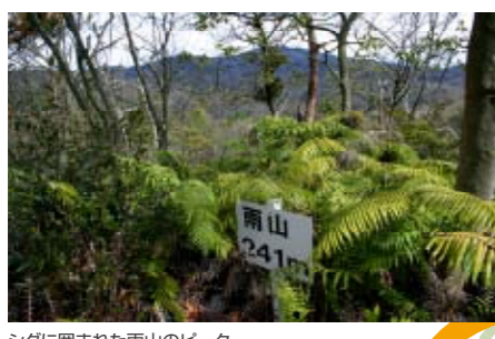
シダに囲まれた雨山のピーク。