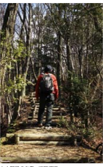
丸太階段の登って尾根道へ。