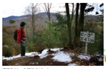
標高241mの最後のピーク。

再びピークを踏んで青年の城へ帰りは自転車道をウォーキング 堰堤横の急な丸太階段を登りつめると眼下に希望の橋が望めます。さらに先へ進むと241mと記された最後のピーク。間近を通る名神高速道路の喧騒が響いてきます。ここから一気に下ると東ゲートの青年の城です。