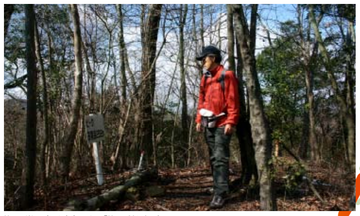
笹尾ヶ嶽のピーク(プレートは「笹尾岳」と表記)。