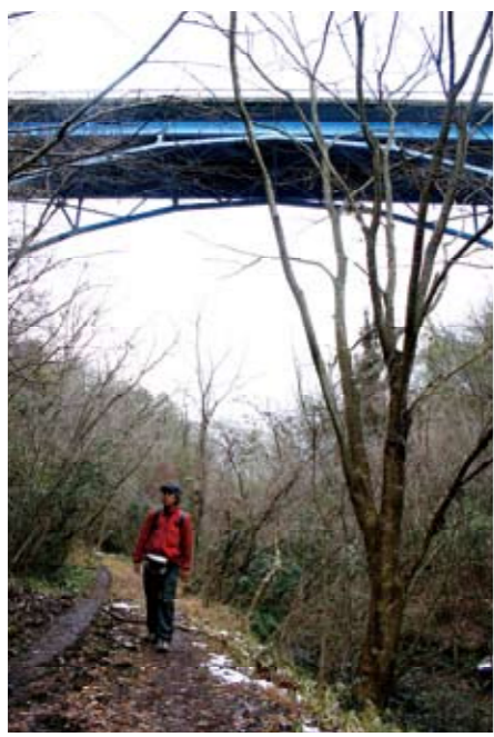
荒川谷から希望の橋を仰ぐ。